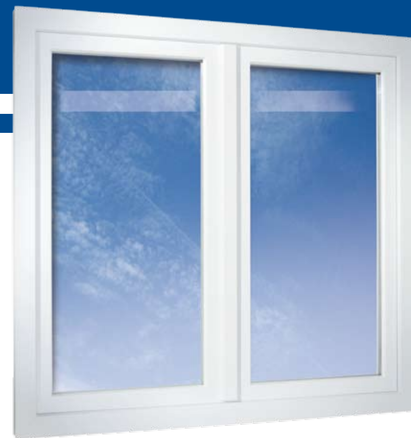
2-křídlové okno s rámem plošně odsazeným